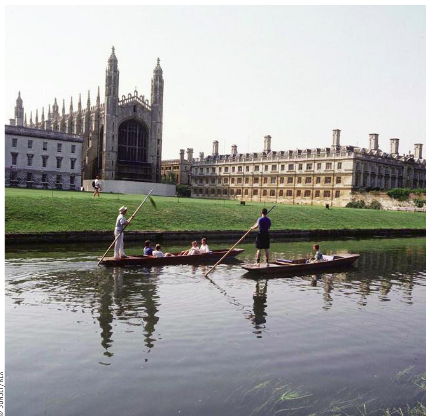
La région de Londres totalise plus de 13 millions d'habitants mais près d'un tiers de moins d'inscrits qu'en Île-de-France, en raison d'un taux de scolarisation dans le supérieur traditionnellement moindre au plan national.

Par ailleurs, selon les disciplines, le quasi «système de noria» alimentant Paris diffère également : la géographie hiérarchisée des accès au centre passant soit par le grand bassin parisien et les universités nouvelles, soit directement depuis les grands pôles régionaux [7].