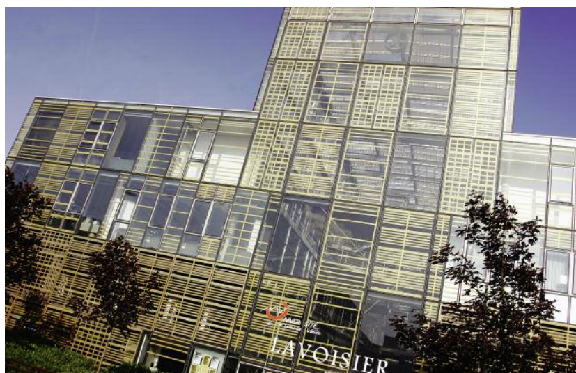
La mise en oeuvre de l'espace européen de l'enseignement supérieur et le renouvellement générationnel des enseignants-chercheurs permettent-ils d'envisager une recomposition du paysage de l'enseignement supérieur et de la recherche ?

À ces découpages se sont ajoutés ceux issus du plan Université 2000 au cours duquel ont été créées les quatre universités sises dans les villes nouvelles du plan Delouvrier. En sus des opposi-