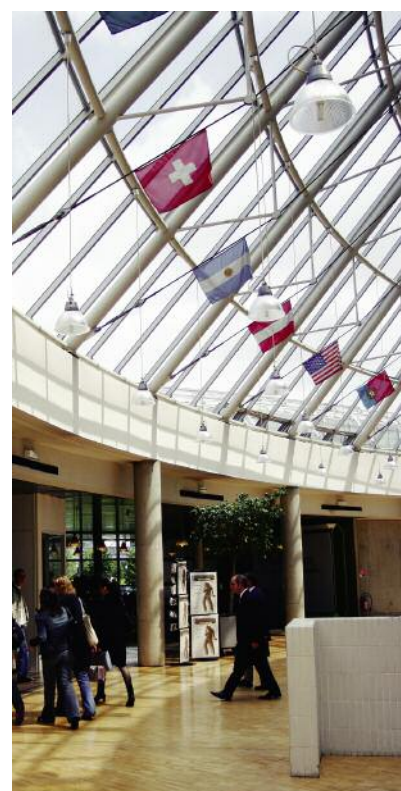
L'exception quantitative de la concentration métropolitaine francilienne s'exprime en chiffres : plus du quart des effectifs de l'enseignement supérieur y est concentré...

Rien de surprenant à ce que les capitales captent une large part des mobilités étudiantes étrangères, même si l'exemple de Rome constitue à cet égard une exception tout à fait remarquable.