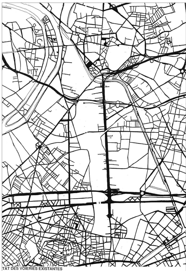
Trame viaire 1994

Il a permis la mise en place d'un process opérationnel : 9 procédures opérationnelles publiques (ZAC) sont développées par les partenaires publics, la revalorisation par les propriétaires de leurs patrimoines est importante.