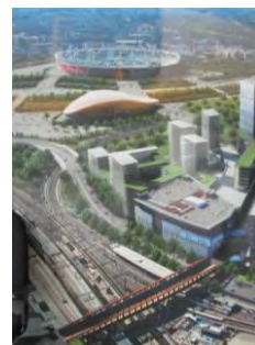
Londres : l'élan provoqué par les jeux olympiques...