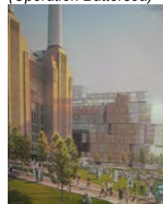
...survivra-t-il à la crise financières ? (Opération Battersea)