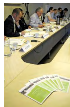
Vers un partenariat renforcé avec les territoires

Le développement de ces études de territoires et celui de ces démarches partenariales impliqueront une adaptation de l'organisation de travail, dans le prolongement de la réflexion entreprise dans le cadre du chantier « IAU île-de-France demain » (équipes projet, démarche de prospection).