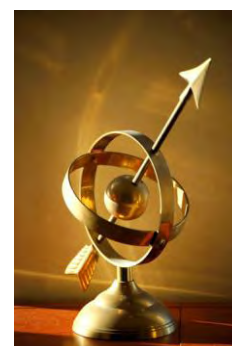
La qualité de l'observation et de l'analyse des données... une exigence première

Enfin, l'Institut s'est engagé dans la réalisation d'enquêtes portant sur des champs nouveaux, afin de répondre à des besoins de connaissance non couverts par les dispositifs statistiques existants.