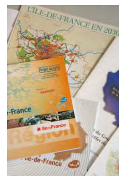
La révision du Sdrif au cœur des travaux de l'Institut en 2012