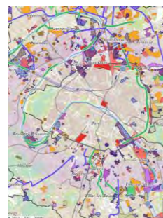
La carte projets outil de connaissance des potentiels de développement

En effet, la multiplication de ces études de projets de territoires pose plusieurs questions, et notamment celle de l'articulation entre enjeux régionaux et enjeux locaux, ainsi que la question de la cohérence d'ensemble des multiples projets en cours de gestation.