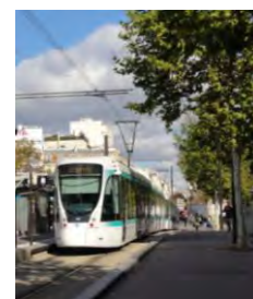
Les projets de charte : pour une meilleure articulation entre transport et urbanisme