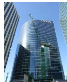
Comprendre la stratégie des acteurs et son impact sur l'aménagement (Tour Dexia à La Défense)

Ce travail de veille et de prospective se nourrira bien sûr de comparaisons internationales (les exemples de Londres, Berlin et Madrid font déjà l'objet de travaux comparatifs) mais aussi de l'analyse des données les plus récentes qui nous parviendront au cours des prochains mois et nous permettront de rafraîchir notre perception des comportements des Franciliens, des entreprises et des collectivités.